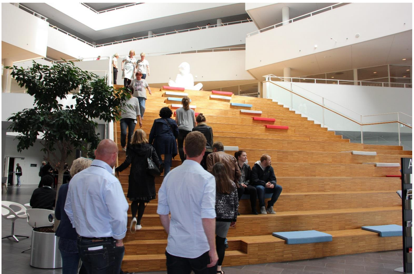
Husets centrale trappe, som også bruges som opholdssted for medarbejderne og de mange besøgende i Rådhuset.