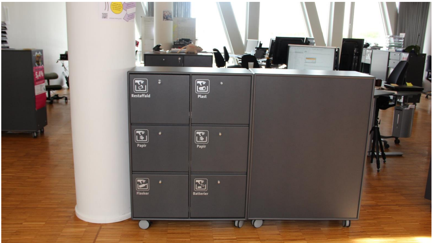
Affaldssortering er samlet på 26 stationer i huset. På den måde sparer man udgifter til rengøring og tømning af skraldespande mm.