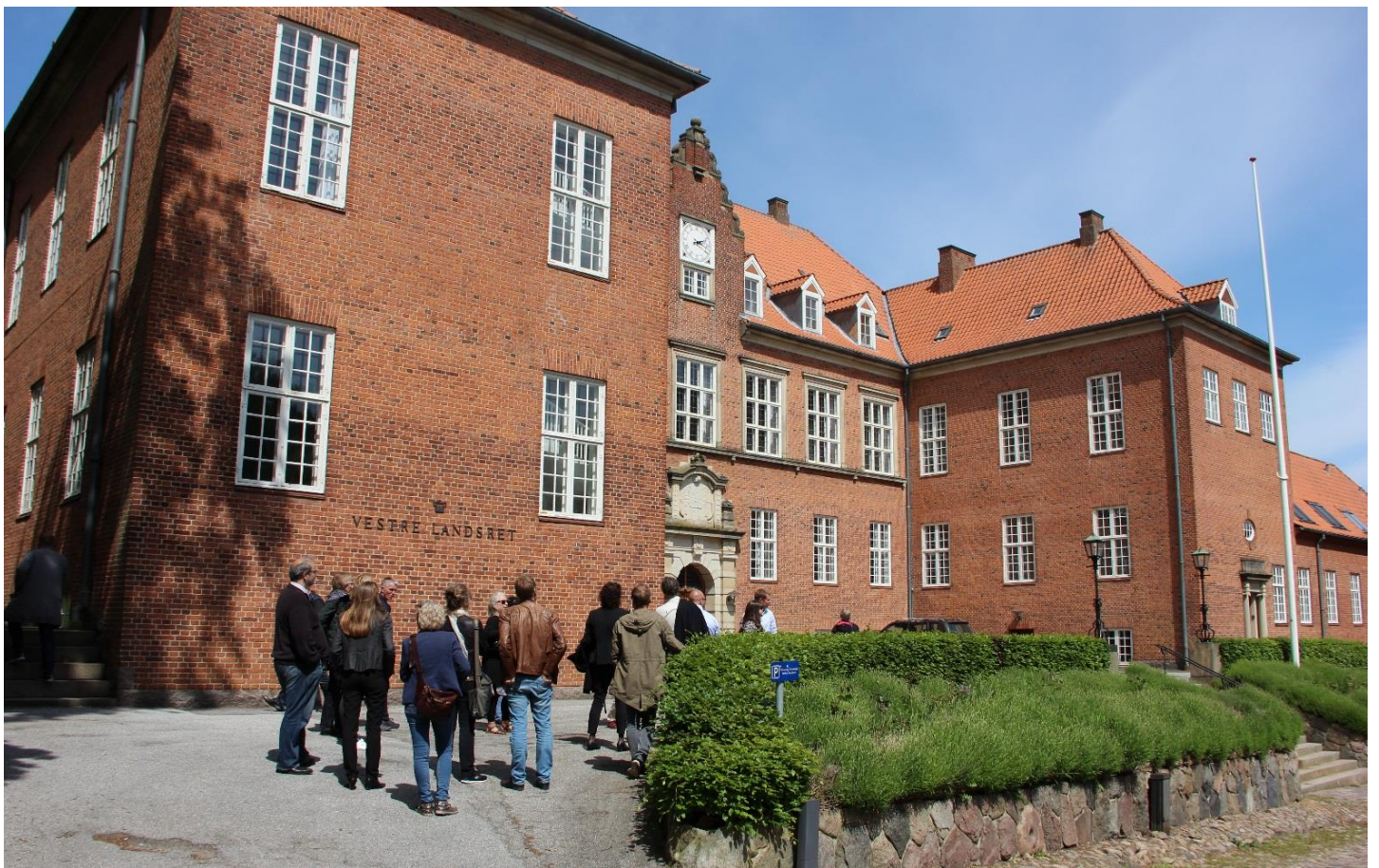
Den gamle Vestre Landsret