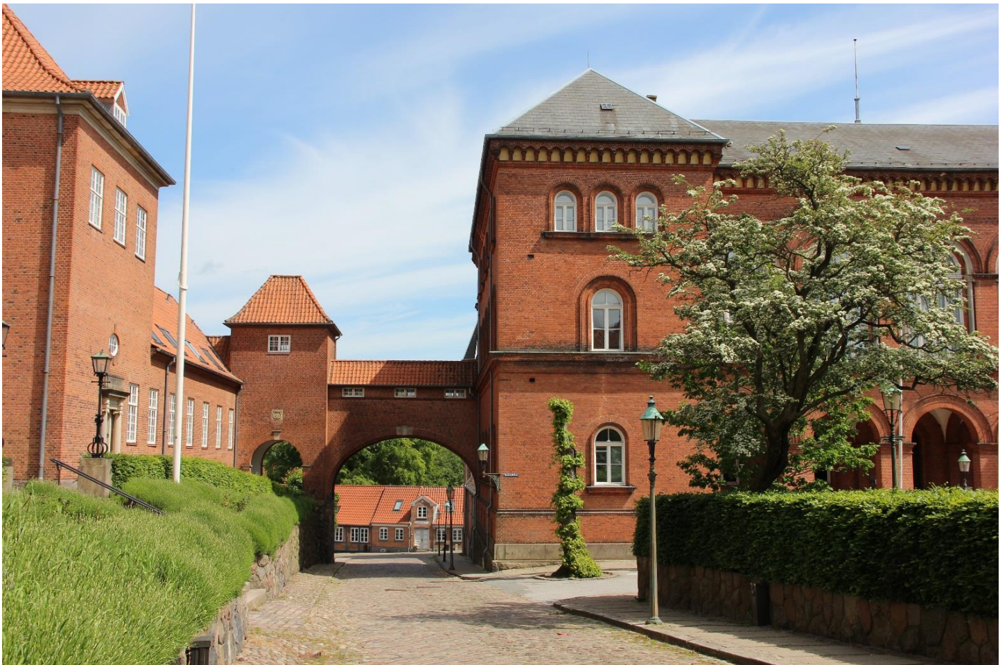
"Sukkenes Bro" ved den gamle Vestre Landsret