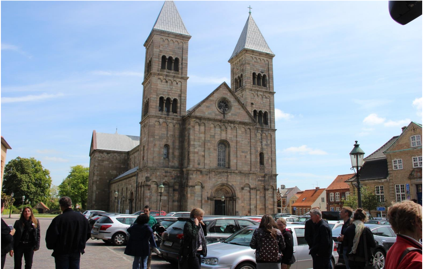
Byvandring i det gamle Viborg. Viborg er en af Danmarks ældste byer med en spændende historie og en hyggelig og velbevaret middelalderbykerne omkring den gamle Domkirke.