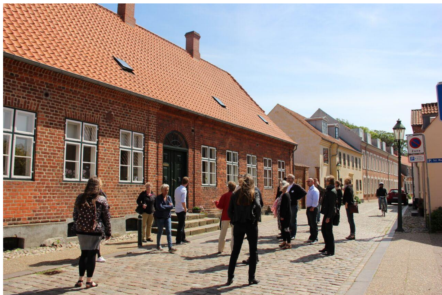
Sct. Mogens Gade i Viborg - en af Danmarks ældste og mest historiske gader.